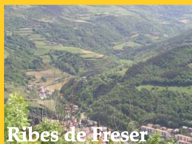
Ribes de Freser